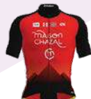
TEAM FEMININ CHAMBERY