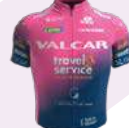
VALCAR TRAVEL & SERVICE