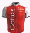
COFIDIS WOMEN TEAM