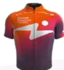
HUMAN POWERED HEALTH