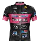
VC MORTEAU MONTBENOIT