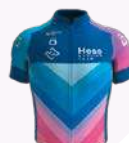
HESS CYCLING TEAM