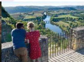
© CD 24 - D. Nidos