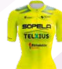
SOPELA WOMEN'S TEAM